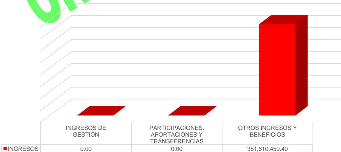
Gráfico 1. Ingresos